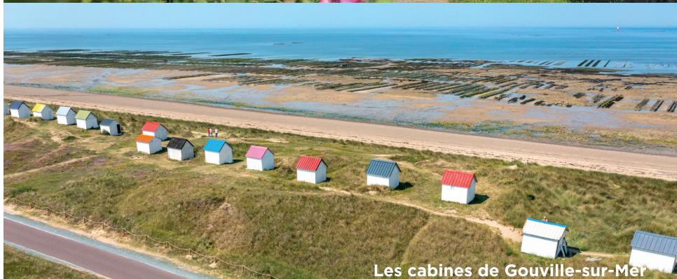
Les cabines de Gouville-sur-Mer