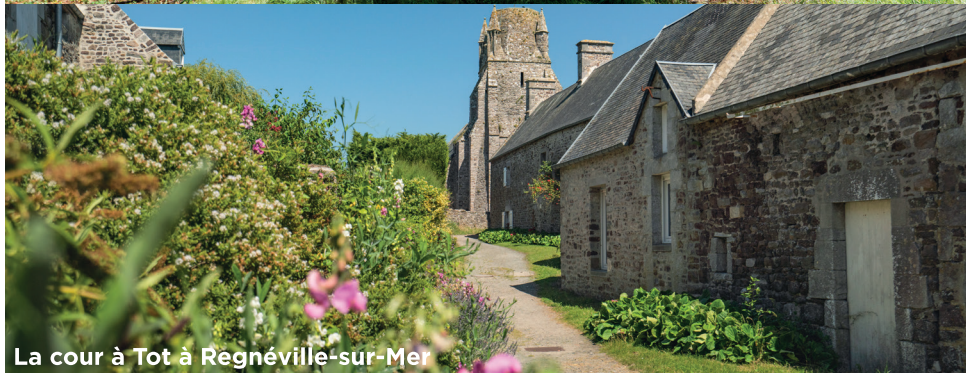
La cour à Tot à Regnéville-sur-Mer