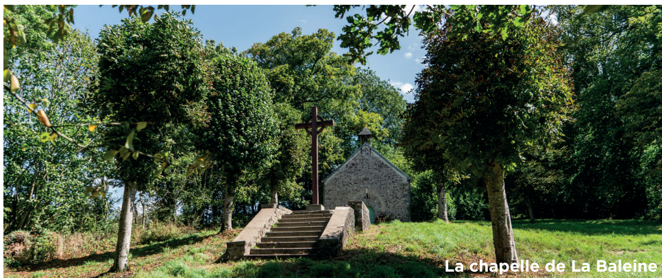
La chapelle de La Baleine