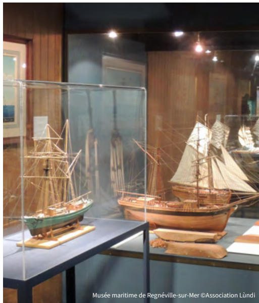
Musée maritime de Regnéville-sur-Mer