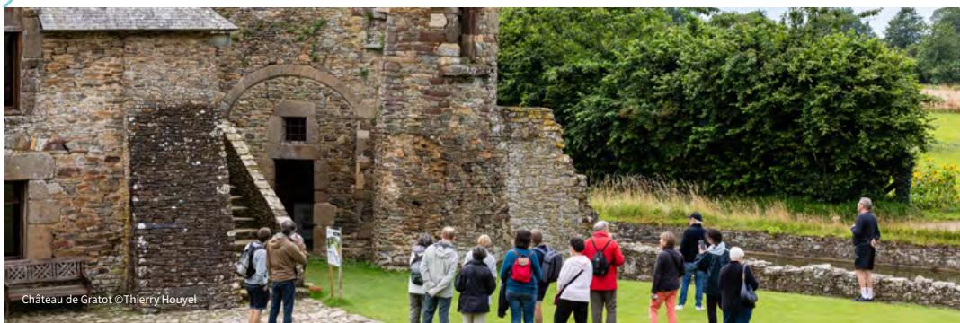
Château de Gratot

Saviez-vous que les fils de Tancrede, originaires de Hauteville-la-Guichard, sont partis à la conquête de l'Italie du Sud au 11 e siècle ? Découvrez cette épopée.