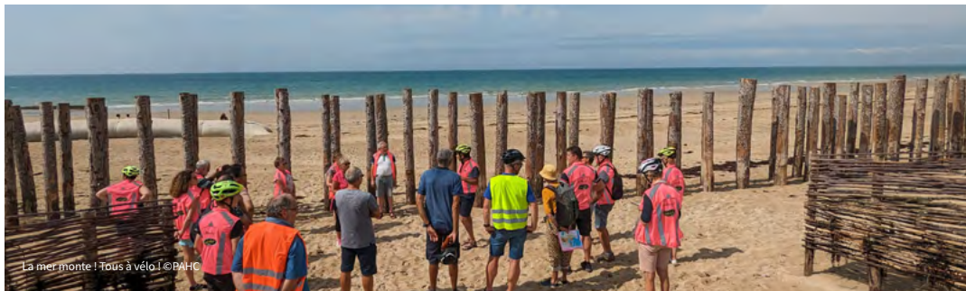
La mer monte ! Tous à vélo !