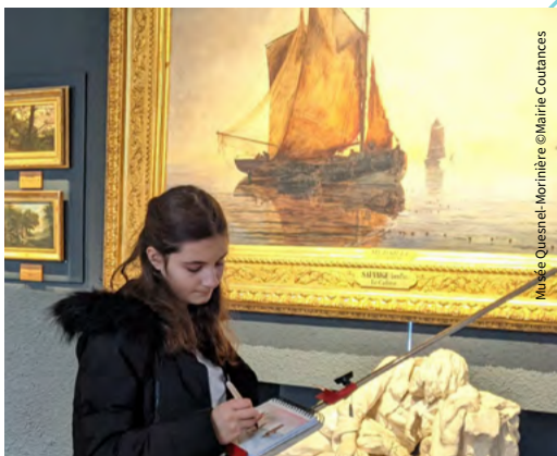
Musée Quesnel-Morinière

Location de vélo électrique possible lors de la réservation.