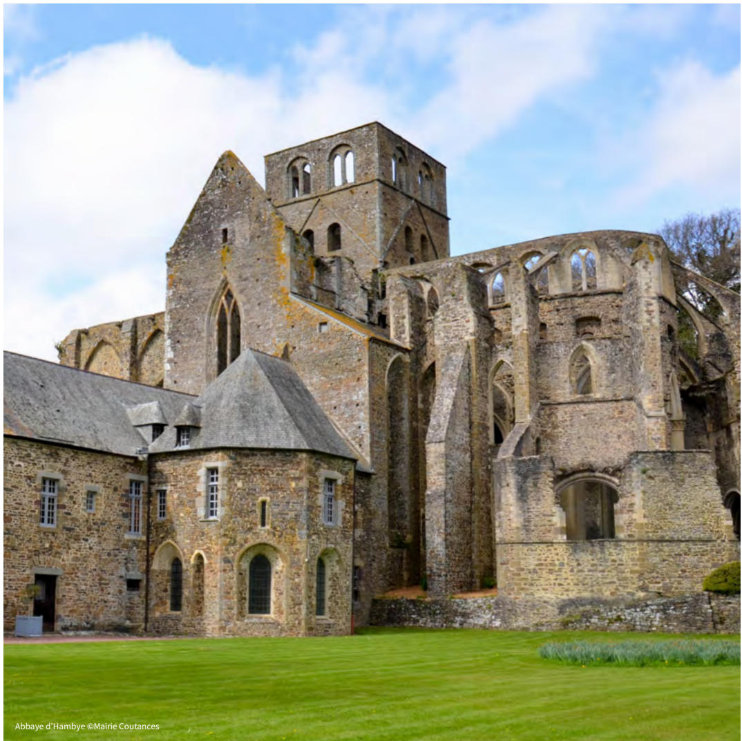
Abbaye d'Hambye