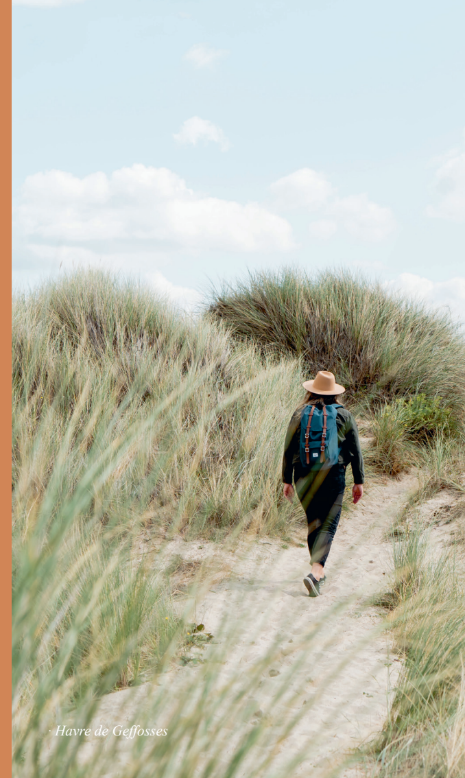
Havre de Geffosses