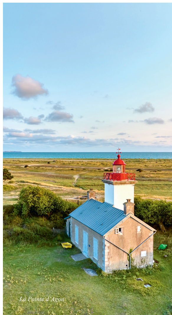
La Pointe d'Agon

Au cœur d'un lieu exceptionnel aux allures de bout du monde, vous randonnerez au milieu des dunes et des moutons de prés-salés.