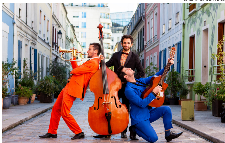
BAZAR ET BEMOLS