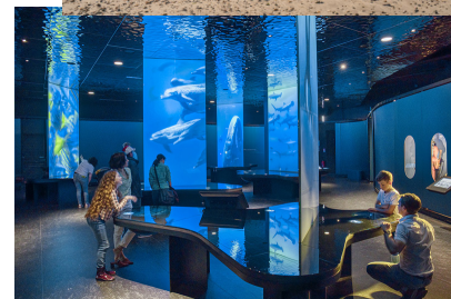
Cité de la Mer