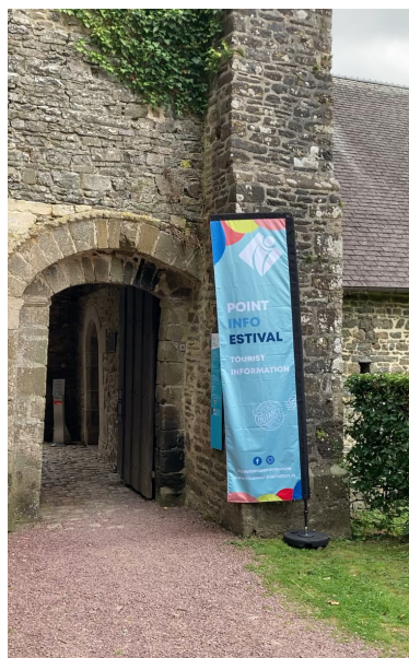
Bureau hors-les-murs de Hambye

du mardi au samedi de 10h à 13h et de 14h à 18h.