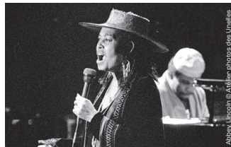
Abbey Lincoln