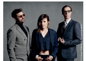
Caravan Palace