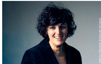
Marion Rampal

Coproduction / Production Jazz sous les pommiers, Pôle de référence jazz de Coutances ; L'Astrada Marciaç, Scène conventionnée d'Intérêt national ; Les Gémeaux, scène nationale de Sceaux.